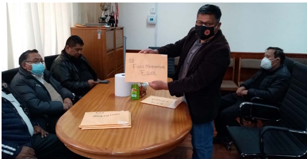
Figura: Apertura de sobres de la EPCFM-Física.