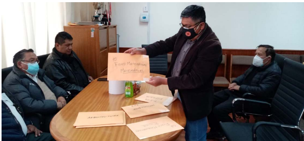
Figura: Apertura de sobres de la EPCFM-Matemática.