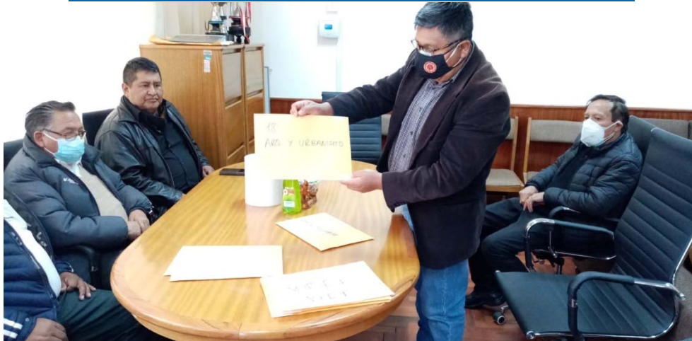
Figura: Apertura de sobres de la EPAU.