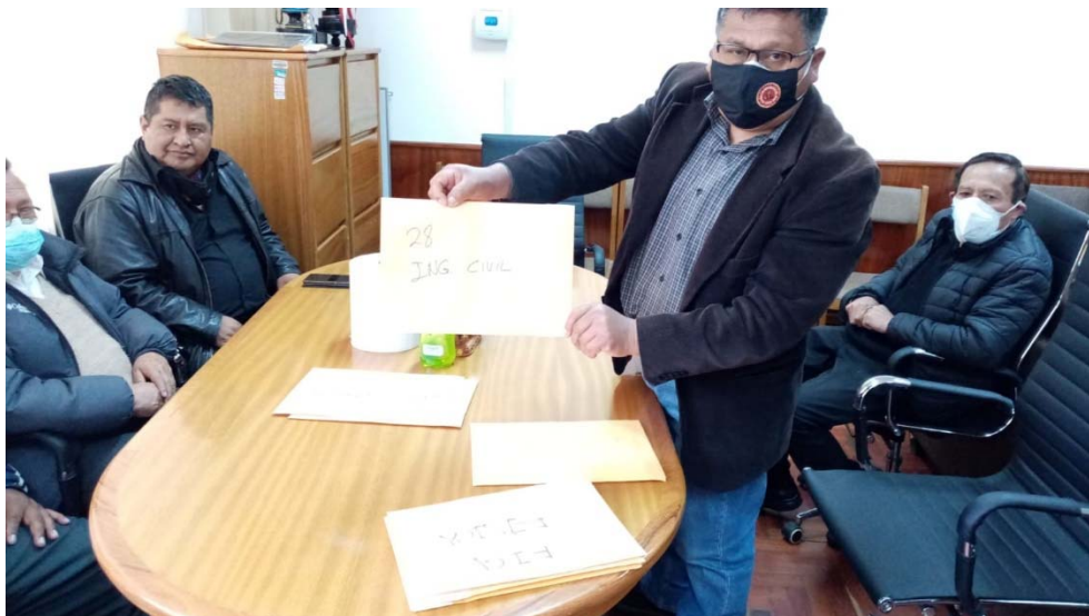
Figura: Apertura de sobres de la EPIC.