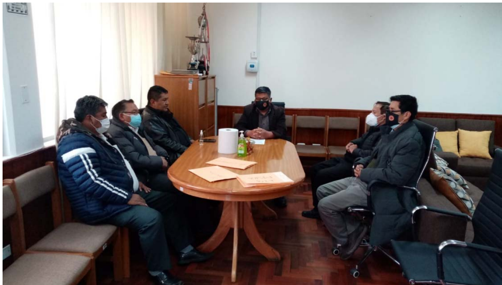
Figura: Reunidos los directores de la FICA en la oficina del Decanato.