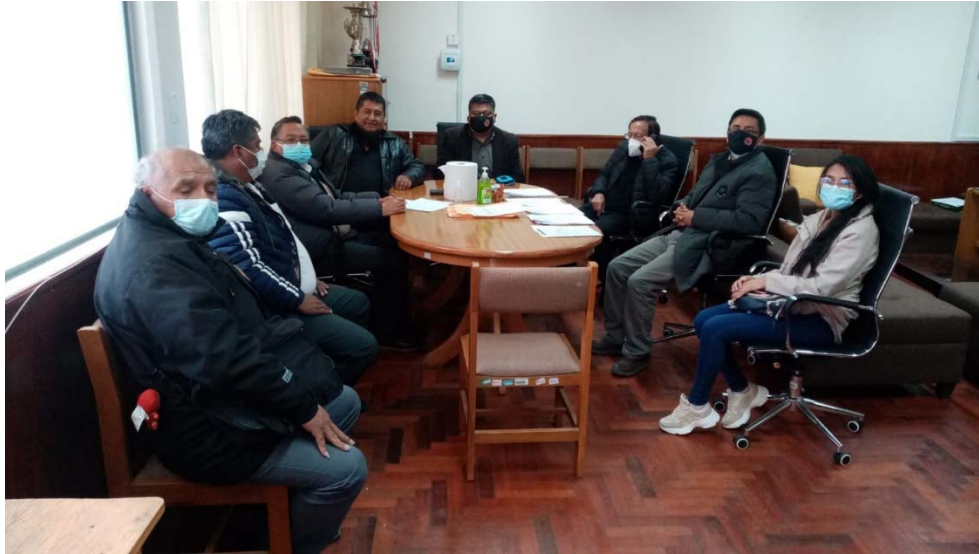
Figura: Reunidos los miembros de consejo y directores convocados en la oficina del Decanato.

Se realiza el consolidado de las puntuaciones de las diferentes plazas, las mismas que se tratará en consejo virtual, por tanto, este documento no es un Acta, sino mas bien un reporte de las actividades realizadas en la presente fecha.